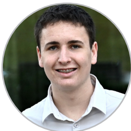
RAPHAEL INTEGRATION & PRODUCTION SERVICES MEMBER SINCE 2022

„Das Team bei INNOFORCE ist sehr humorvoll eingestellt und die offene Fehlerkultur unterstützt mich dabei, die Lernziele meiner Ausbildung auf angenehme Art zu erreichen.“