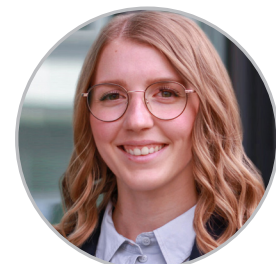
CORINA MARKETING & SALES MEMBER SINCE 2021

„Die weltweite Vermarktung von Produkten, die medizinisches Personal hilfreich unterstützen ist erfüllend, denn der positive Impact dieser ist im Kundenkontakt deutlich spürbar.“